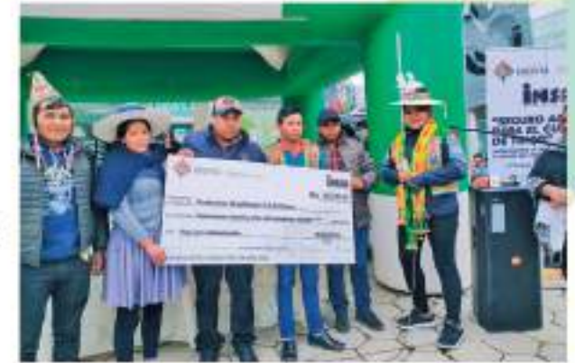
Potosí - Llallagua 16 de marzo de 2022