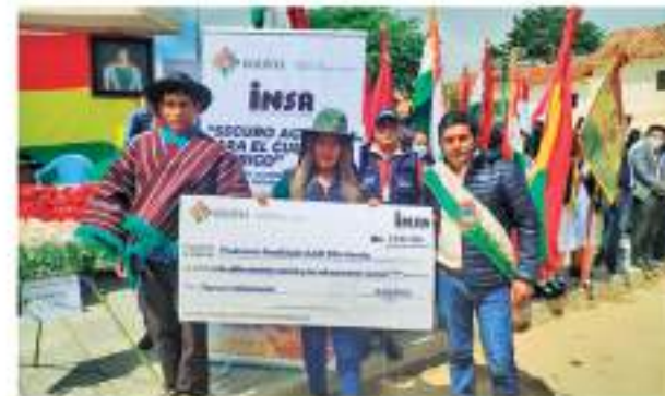
Sucre - Villa Azurduy 14 de marzo de 2022