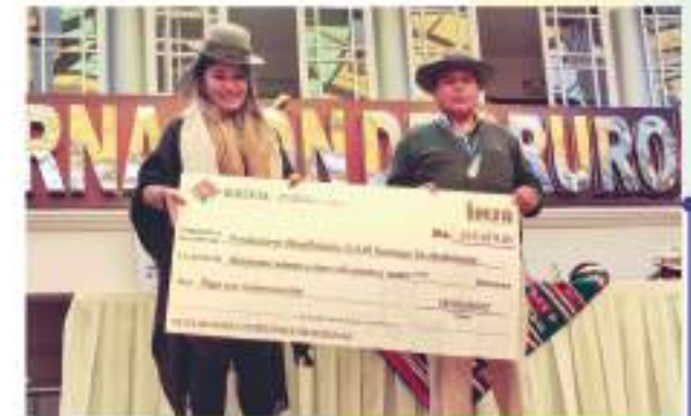
Oruro 18 de marzo de 2022